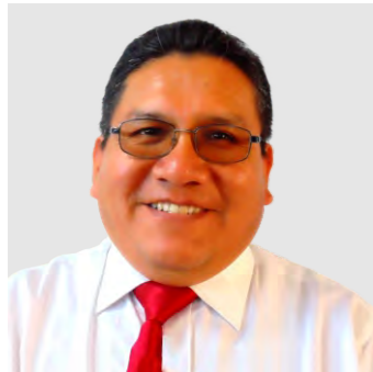
Doctor Contador Público Colegiado