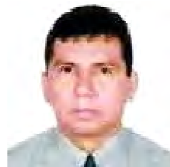
Contador Público Colegiado Master of Business Administration