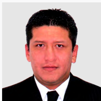
Magíster Contador Público Colegiado