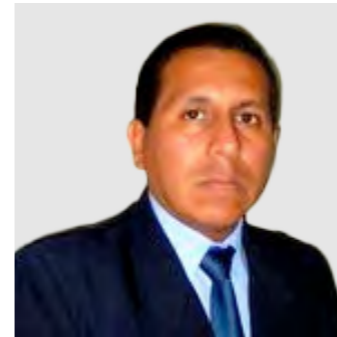
Contador Público Colegiado